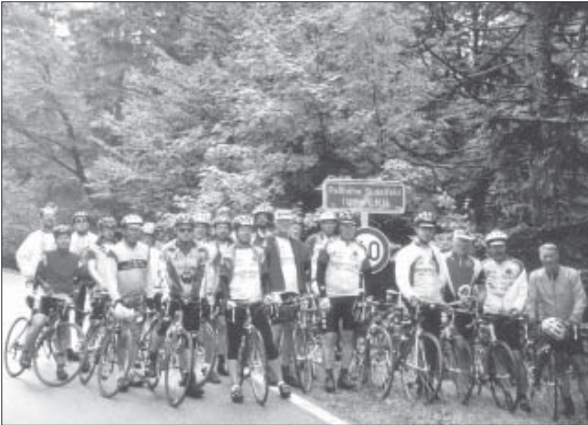
Nach erfolgtem Gipfelsturm in 1123 m Höhe auf dem Sudelfeldpass.

hatte. Dies sollte sich in den nächsten Tagen bei den Durchfahrten in Eilenburg, Grimma, Schwarzenberg und hinauf nach Johanngeorgenstadt wiederholen. Unvorstellbar, was Wasser anrichten kann. Jetzt flossen Elbe, Mulde, Zwickauer Mulde und Schwarzwasser friedlich dahin. Schon am dritten Tag stand die Königs-