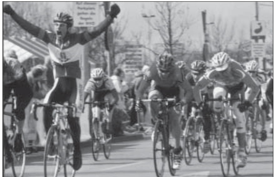
Es gilt neue Quellen zu erschließen, um dem Nachwuchs Startmöglichkeiten zu bieten. Hier der spannende Zieleinlauf der Junioren bei Berlin-Bad Freienwalde-Berlin.

nichts eine goldene Spitze aufs Dach zu setzen, wenn das Fundament brüchig ist. Im Kern des Antrags geht es vor allem darum, dass es zu wenige Radrennen für den Nachwuchs gibt. Gemeint sind damit vor allem Schüler- und Jugendrennen. Warum ist das so? Gründe gibt es dafür mehrere. Jeder Veranstalter schaut darauf sein Radrennen so zu organisieren, dass es attraktiv für Zuschauer und Sponsoren ist und dass er zumindest keinen finanziellen Verlust macht. Doch wie liefen Veranstaltungen früher ab. Um acht Uhr ist der erste Start. Wenn man möglichst alle Rennklassen starten lassen möchte, kommt man schon mal auf bis zu acht Radrennen. Dann ist man so gegen 17 Uhr mit der letzten Siegerehrung fertig. Die Helfer jedoch waren schon seit sechs Uhr mit dem Aufbau beschäftigt und haben teilweise noch bis 19 Uhr mit Aufräumarbeiten zu tun. Der WA war