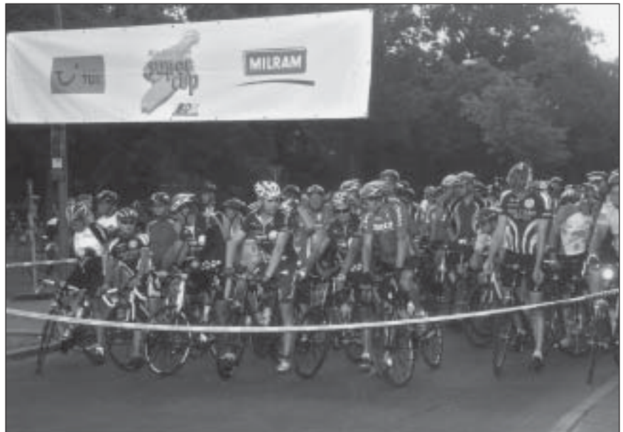
An Startern hat es im RTF kaum Mangel. Sie wünschen sich aber nun mehr jüngere Mitstreiter.

Die drei Jahre dauernden Bemühungen um ein Jedermannrennen in Berlin haben endlich Erfolg. Am 25. Mai startet der Skoda Velothon zum ersten Mal. Mit 5000 Anmeldungen war der Zuspruch auf Anhieb enorm. Mehr darüber dann im Jahresbericht 2008.