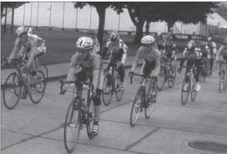
Hoch im Kurs stehen die Rennen um den Straßenpokal im Sportforum.

Für die große Unterstützung der Übungsleiter und ehrenamtlichen Helfer 2007 möchte ich mich recht herzlich bedanken. Für eine Wiederwahl als Jugendleiter stehe ich 2008 aus persönlichen Gründen nicht mehr zur Verfügung.