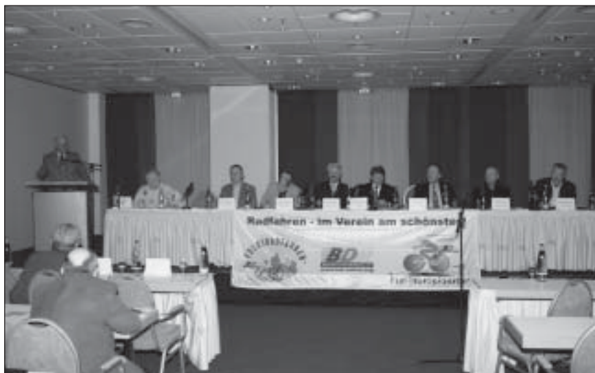
Blick auf das Präsidium der Jahreshauptversammlung im Estrel.

Wolfgang Scheibner beklagte die Schwierig-